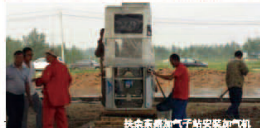
扶余东路加气站安装加气机

集团旗下昆仑燃气有限公司各个加气站进展顺利,其中扶余东路加气站的所有设备正在安装中。7月22日,扶余东路加气站罐体,安全顺利的完成吊装,25日,保质保量的完成加气机的安装,预计此站一个月左右可以对外运营加气。