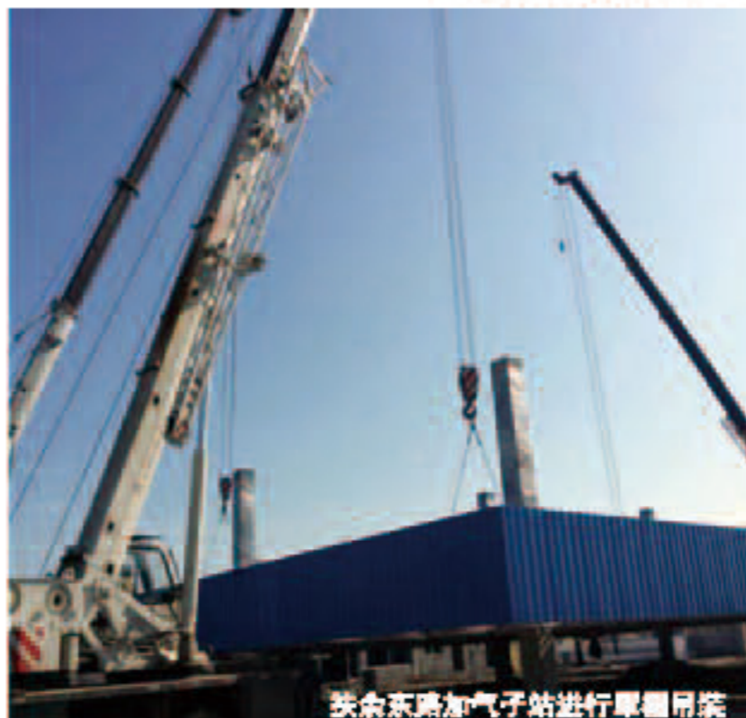
扶余东路加气站进行罐体吊装