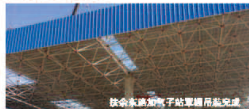
扶余东路加气站屋顶吊装完成